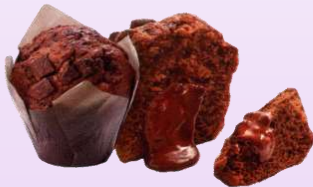
Cacao e nocciola