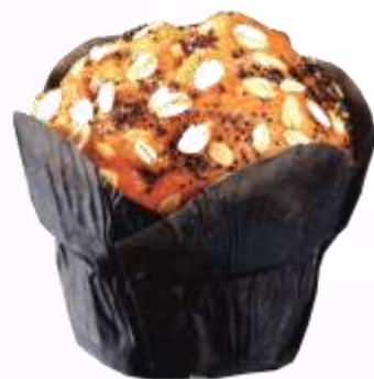
Cereali e frutti rossi