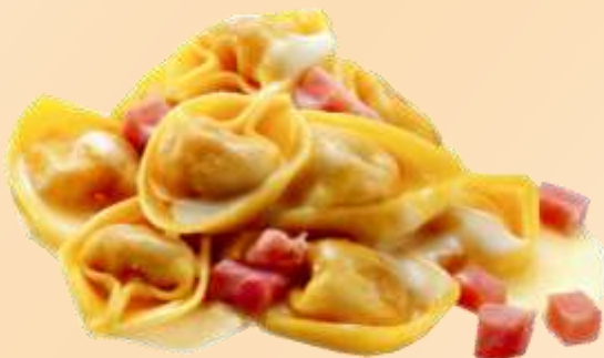
Tortellini bolognesi con panna e prosciutto