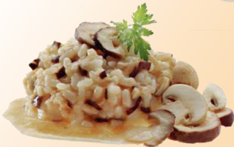
Risotto con funghi porcini