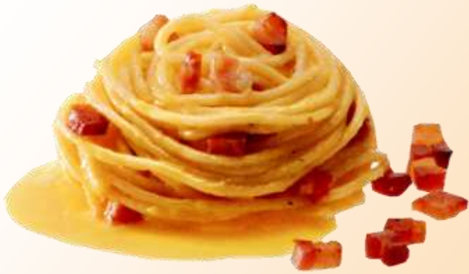
Spaghetti alla carbonara