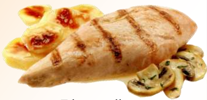
Filetto pollo funghi e patate