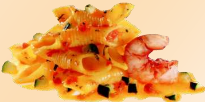
Garganelli gamberi e zucchine