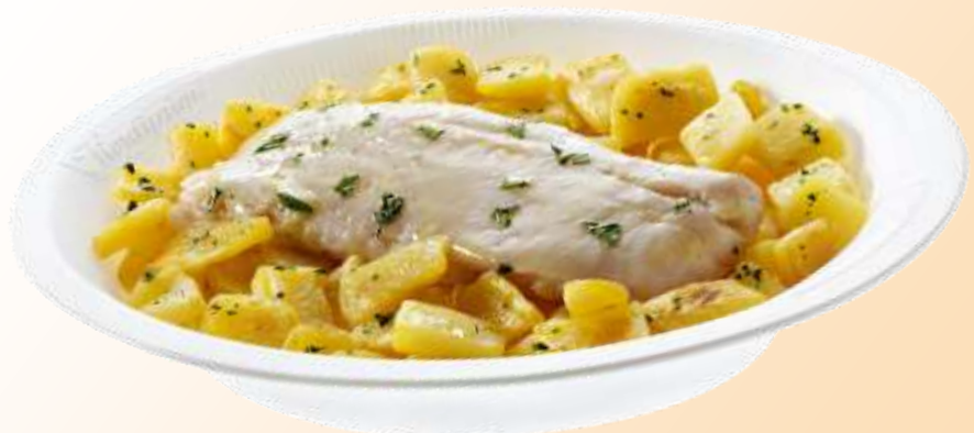
Filetto di merluzzo e patate