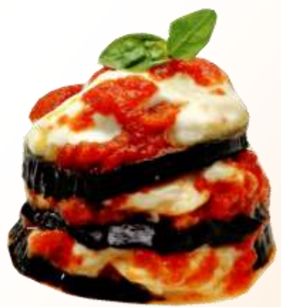
Melanzane alla parmigiana