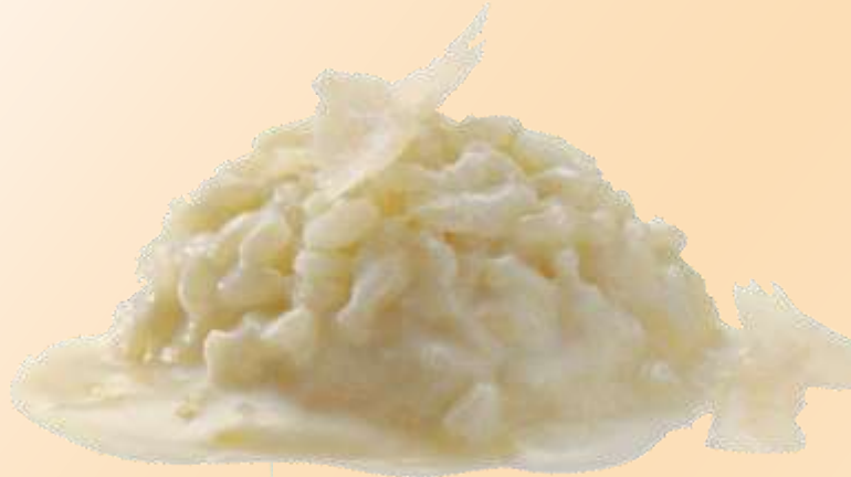
Risotto alla parmigiana