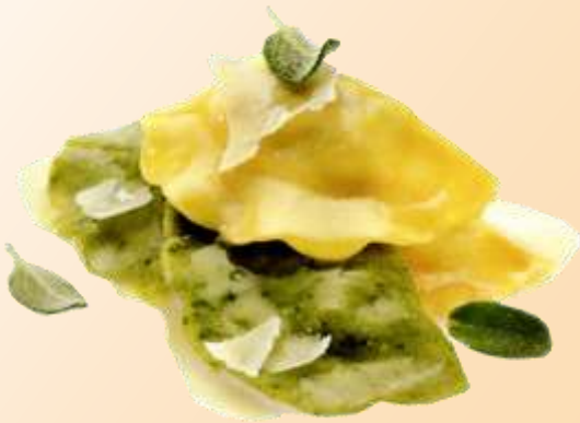
Tortelli mezzaluna burro e salvia