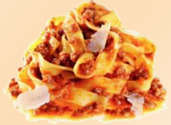
Tagliatelle al ragù