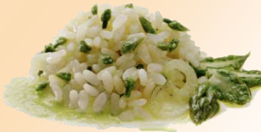
Risotto con punte di asparagi