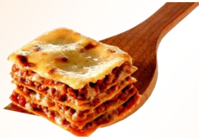
Lasagne alla bolognese