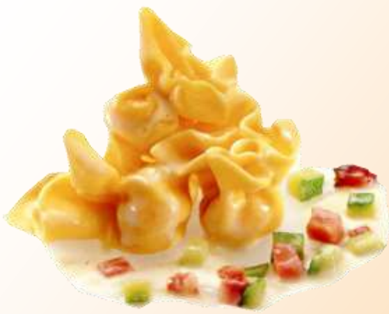
Fiocchetti speck e zucchine