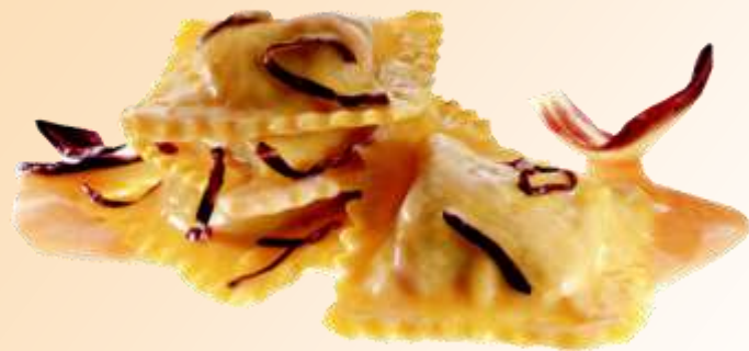
Tortelli al radicchio di Treviso in salsa trevigiana