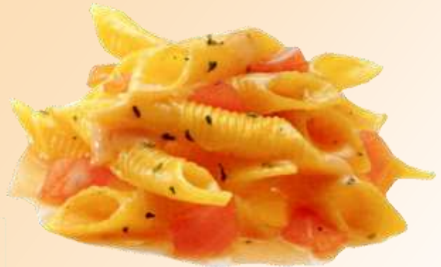
Garganelli al salmone