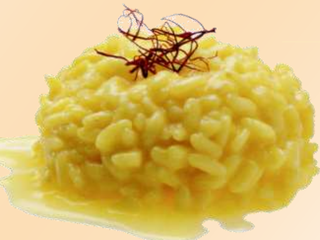
Risotto allo zafferano