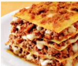
Lasagne alla bolognese