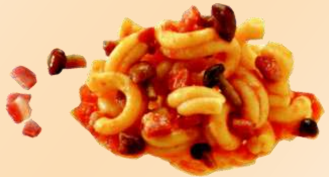
Strozzapreti speck e funghi