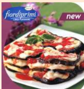
Melanzane alla parmigiana