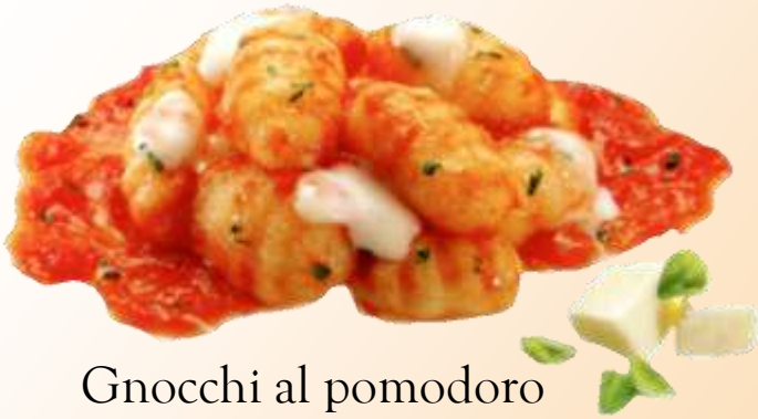
Gnocchi al pomodoro