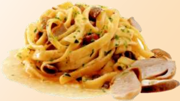
Taglierini ai funghi