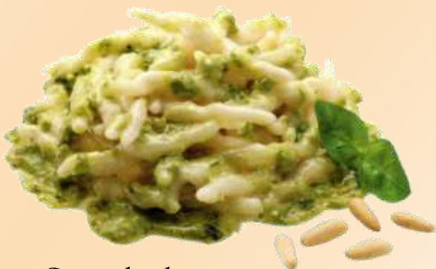
Strigoli al pesto genovese