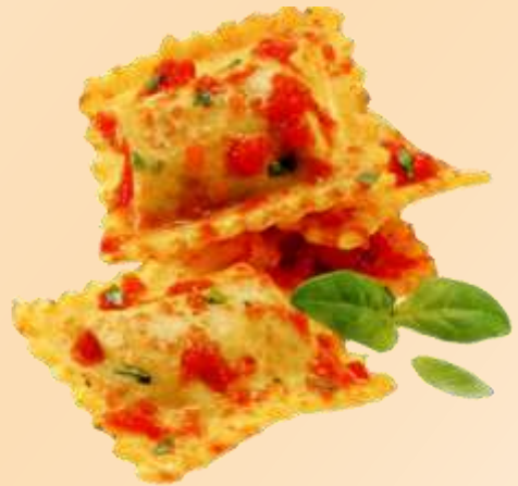
Ravioli pomodoro basilico