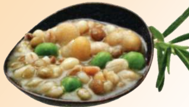
Zuppa rustica di cereali e legumi