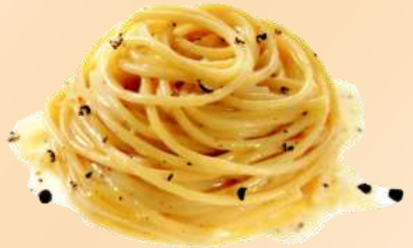
Spaghetti cacio e pepe