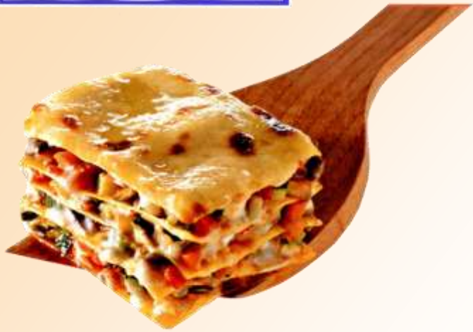
Lasagne alle verdure