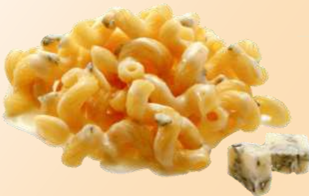
Svitati ai 4 formaggi