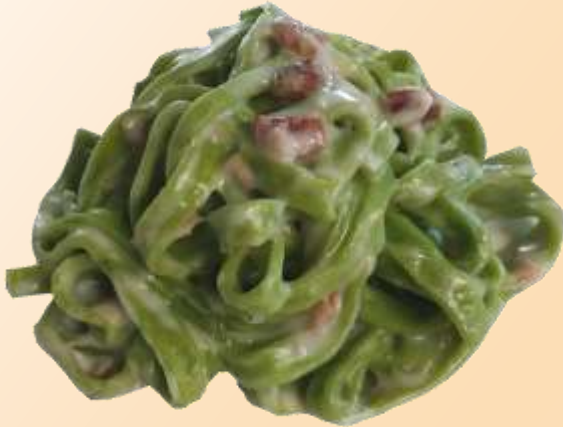
Taglioline verdi panna e speck